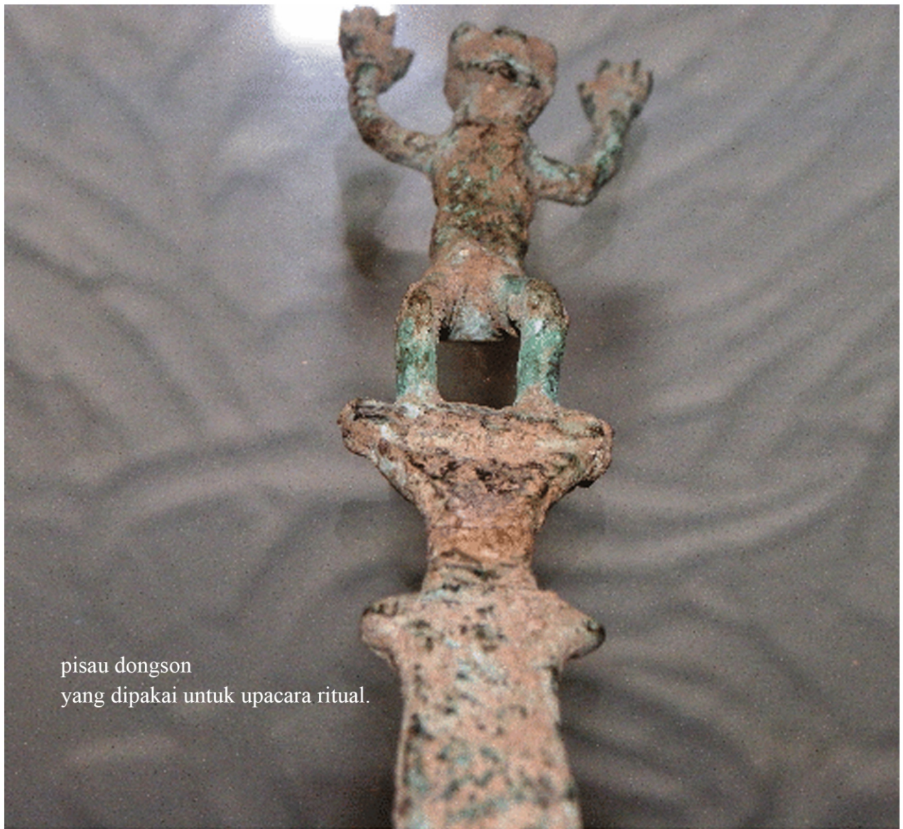
pisau dongson yang dipakai untuk upacara ritual.

Perkembangan kebudayaan zaman perundagian dipengaruhi oleh kebudayaan Dongson. Kebudayaan yang dipengaruhi terutama alat-alat yang dibuat dari perunggu. Penemuan kebudayaan Dongson pertama kali dilakukan oleh Payot.